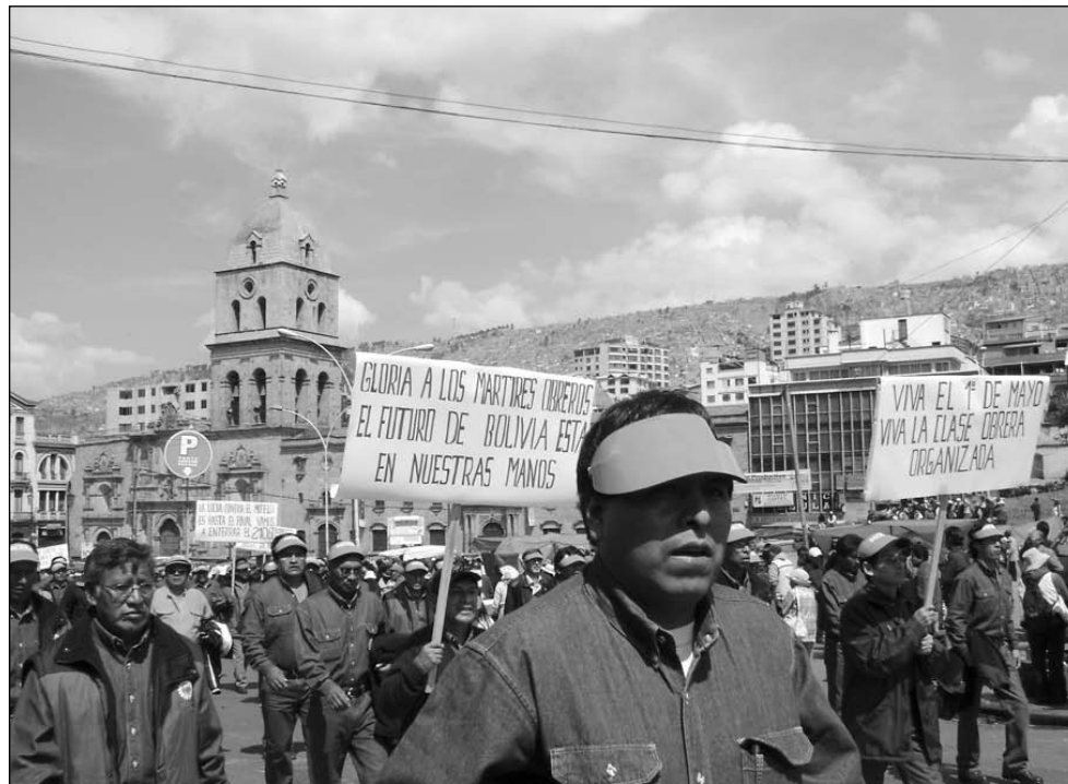
La COB en la marcha del 1º de mayo de 2008. Este año una movilización similar ¿buscará retomar sus principios de clase?

El actual Gobierno, a través de la prebenda, no ha hecho otra cosa que corromper a las organizaciones sindicales, y ha ido más allá aún: “ha terminado controlando todo lo que se llama manejo sindical de las organizaciones matrices”