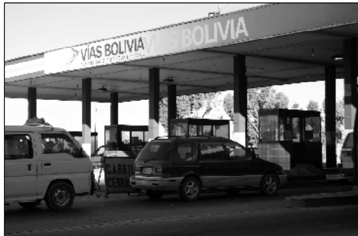
Este es uno de los 128 retenes de peaje de la empresa Vías Bolivia, ubicado en la Autopista La Paz-El Alto.

llenar el formulario 610 que corresponde a los consultores del sector público. Estos elementos ocultan que los llamados consultores se desenvuelven principalmente como trabajadores dependientes, sometidos a un régimen de sobreexplotación laboral.