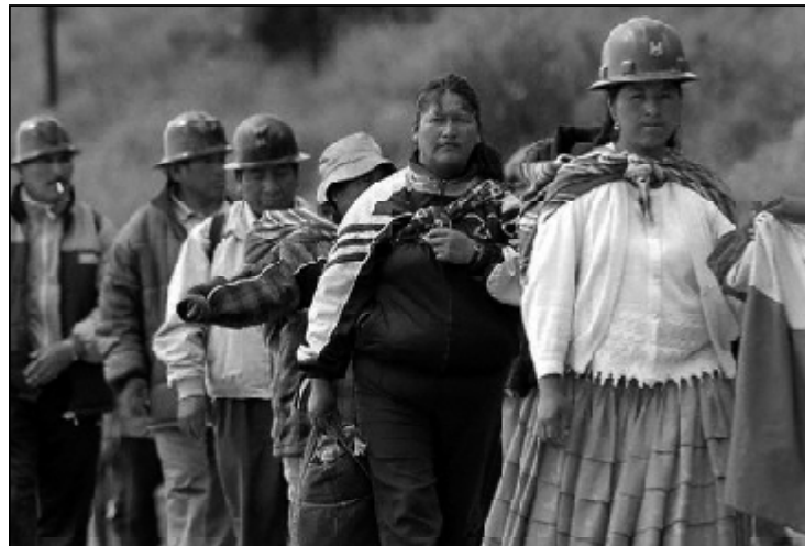
Una vez más, los mineros marchan sin encontrar una respuesta satisfactoria a sus demandas.

que una parte del salario por producto, que sólo puede incrementarse mediante el aumento de la jornada laboral, dando lugar a lo que se conoce como "sobreganancia" por encima del básico. Habiéndose aumentado el salario básico y manteniéndose congelado el precio de contrato, el salario de los trabajadores de Sinchi Wayra, en los hechos, ha disminuido y los trabajadores ahora deben trabajar más para alcanzarlo, quedando reducidas las posibilidades de obtener una "sobreganancia", lo que, generalmente, implica una extensión de la jornada laboral más allá de las 8 horas.